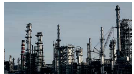
Werke und Produktionsanlagen in aller Welt setzen Maschinen, Komponenten und Systeme aus deutscher Herstellung ein. Entsprechend müssen die begleitenden Dokumente korrekt übersetzt sein.

zung wird nicht nur von fachlich kompetenten Übersetzern angefertigt und einer strengen Qualitätskontrolle unterzogen, bevor sie an den Kunden geschickt wird, sondern es erfolgt darüber hinaus eine unabhängige Korrektur, die von einer anderen qualifizierten Person (nicht der Übersetzer selbst) durchgeführt wird. Daher durchläuft die Übersetzung insgesamt drei Stufen: die Übersetzung und Nachprüfung durch den Übersetzer, das Korrekturlesen und die Qualitätskontrolle, die Noraktrad bei all seinen Übersetzungen durchführt.