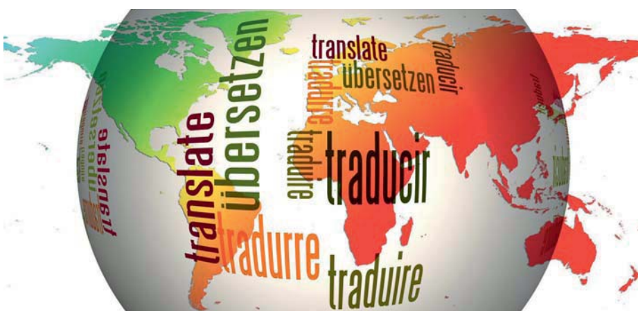
Übersetzungen verbinden Geschäftspartner in aller Welt.

Für Neukunden werden zum Kennenlernen kostenlose Probeübersetzungen angeboten.