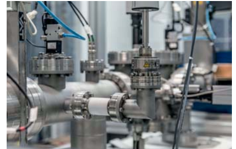
Typische Produkte der Prozessindustrie, die sich weltweit großer Beliebtheit erfreuen.

Die Norm ISO 17100:2015 erweitert dieses Verfahren um eine weitere Stufe. Die Überset-