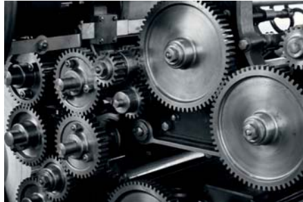
Norak integriert sich nahtlos in die Prozesse der Kunden – ein Rädchen greift ins nächste.

Noraktrad berät und unterstützt passgenau, damit sich die Kunden des Unternehmens voll auf ihr Kerngeschäft konzentrieren können. Entscheidend ist dabei die nahtlose Integration in die Geschäftsabläufe auf Kundenseite und ein Höchstmaß an Flexibilität. Dazu zählen ein zuverlässiger Expressservice, die Konfiguration von Kommunikationsschnittstellen und das Verständ-