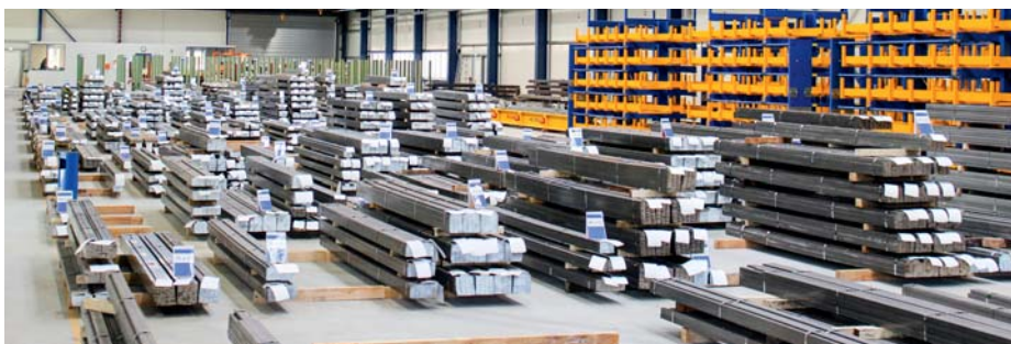
Logistikhalle zur Versandoptimierung

Um den wachsenden Kundenanforderungen gerecht zu werden, sind in den letzten zwei Jahren rund 12 Millionen Euro am Unternehmensstandort investiert worden. Flächenmäßig größte Investition ist hierbei die neu errichtete Logistikhalle. Nach rund einjähriger Bauzeit wurde diese Anfang 2018 in Betrieb genommen. Die neue Halle dient primär der Versandoptimierung und sorgt dafür, dass die 25.000 Tonnen Jahresproduktion an Edelstahlprodukten möglichst effizient verladen werden. Neben ständigen Schulungen der Mitarbeiter bei Einsal, sind noch die folgenden Investitionen in der Produktion zu erwähnen: Eine neue Richtenanlage sowie ein neues Wärmebehandlungs-Aggregat für Spezialstähle werden in 2018 fertig gestellt, beides unter Berücksichtigung höchster Qualitäts-, Umwelt- und Energieanforderungen.