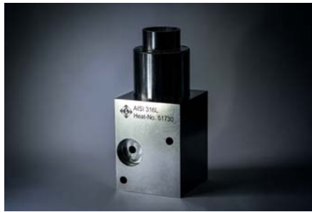
Ventil-Gehäuse und komplexe Drehteile aus Flach- und Vierkantstahl