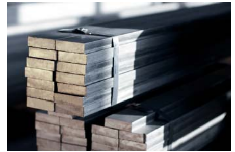
Stabstahl aus Duplex 1.4462

Nachdem erst Mitte letzten Jahres der Abmessungsbereich bei RSH Stählen für warmgewalzte Vierkantstähle nach DIN EN 10059 bis 120 mm erweitert wurde, ist jetzt