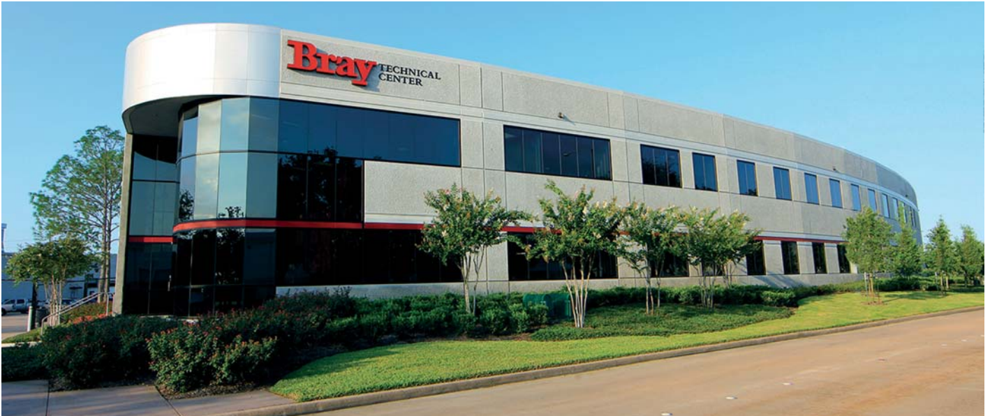
Bray Technical Center, Houston, Texas - hier entsteht unser Know-how