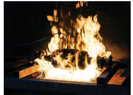
Fire-Safe-Tests gehören bei einigen Hochleistungsarmaturen zum Standard.

Alle Hartmann Kugelhähne verfügen über eine rein metallische Abdichtung zwischen Kugel und Sitzring. Sie sind in der Regel mit zwei Barrieren ausgestattet, welche sich auch im eingebauten Zustand durch Entlüftung des